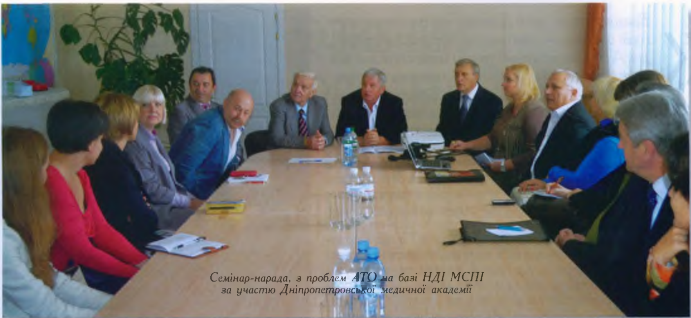
Семінар-нарада, з проблем АТО на базі НДІ МСПІ за участю Дніпропетровської медичної академії