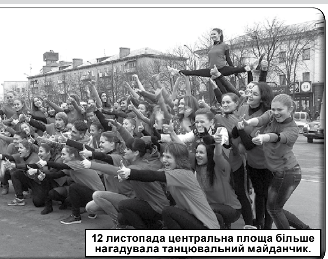
12 листопада центральна площа більше нагадувала танцювальний майданчик.

13 листопада відбувся «День злуки» між корпусами педагогічного університету